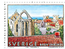
S:ta Karin kyrkoruin

S:ta Karin Drotten S:t Lars S:t Nicolai S:t Clemens