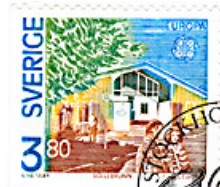
Posthus i Sollebrunn

Rekonstruktion av Kungliga Borgen på Gärdet, Stockholm